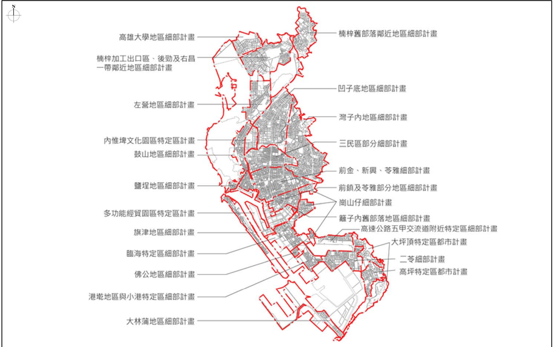
圖 1-3-1 本市（原高雄市轄區）各細部計畫區範圍示意圖