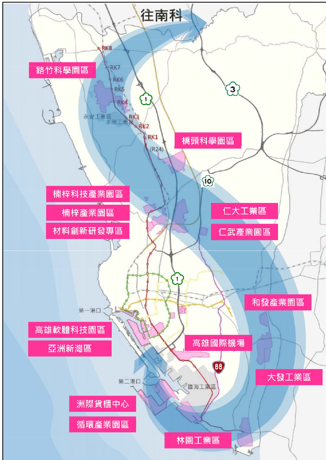
圖 3-3-1 本市重大建設計畫分布示意圖